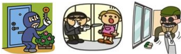
事件・事故の発生