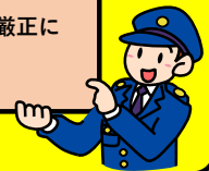
交番・駐在所別自転車に関する交通事故の発生状況(令和3年中)

警察では、自転車運転者の信号無視等に対し、指導警告を行うとともに、悪質・危険な交通違反に対しては検挙措置を講ずるなど、厳正に対処しています。